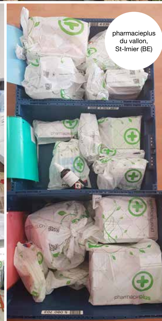
pharmacieplus du vallon, St-Imier (BE)