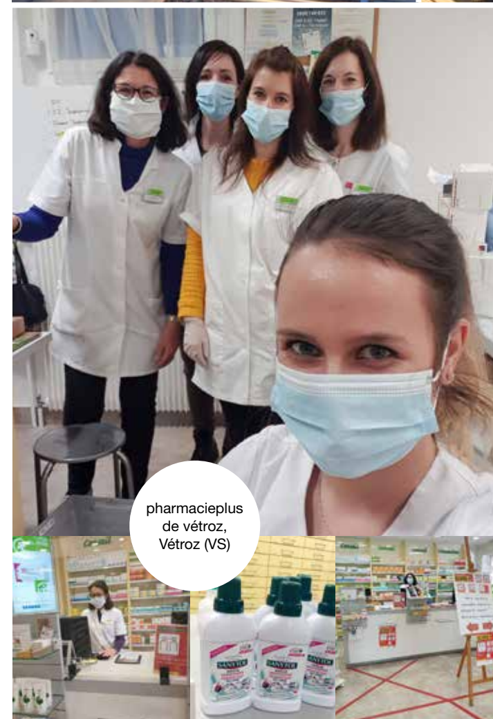
pharmacieplus de vétroz, Vétroz (VS)