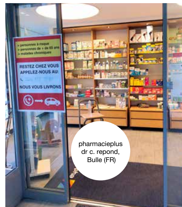
pharmacieplus dr c. repond, Bulle (FR)

Des stratégies d'adaptation multiples et variées «De jour en jour, la situation évoluait et de nouvelles mesures devaient être mises en place. Il a fallu être très réactif et souple dans nos stratégies d'adaptation», explique le pharmacien responsable de la pharmacieplus du vallon. Installation de plexiglas, marquage au sol, cheminement dans la pharmacie, mesures de protection du personnel, livraisons intensifiées des médicaments à domicile, hotline téléphonique, ajustement et affinement des stocks, réorganisation des équipes